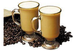
Coffee / Café