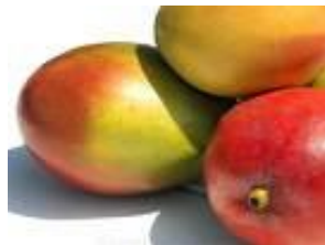
Mangos / Mangos