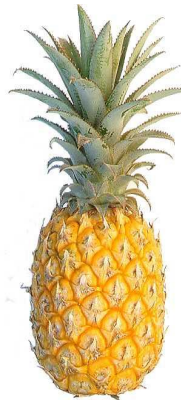
Pineapple / Piña