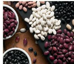
Beans / Frijoles