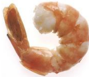
Shrimp / Camarón