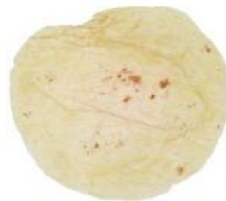
Tortillas / Tortillas