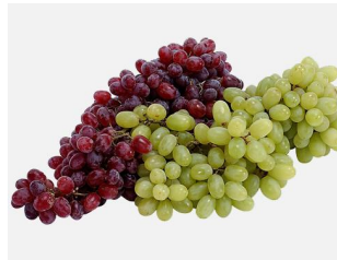
Grapes / Uvas